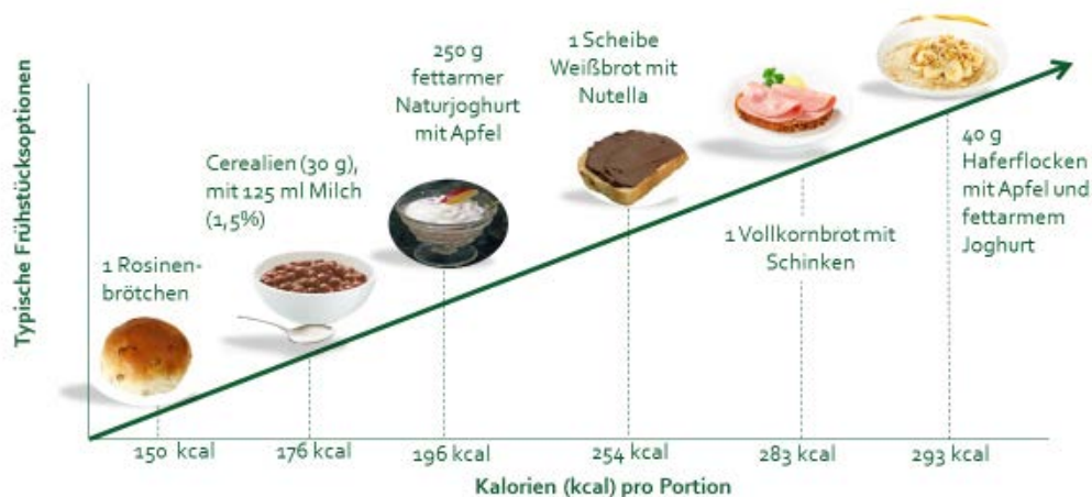
Abb.2: Energiegehalt unterschiedlicher Frühstückskomponenten