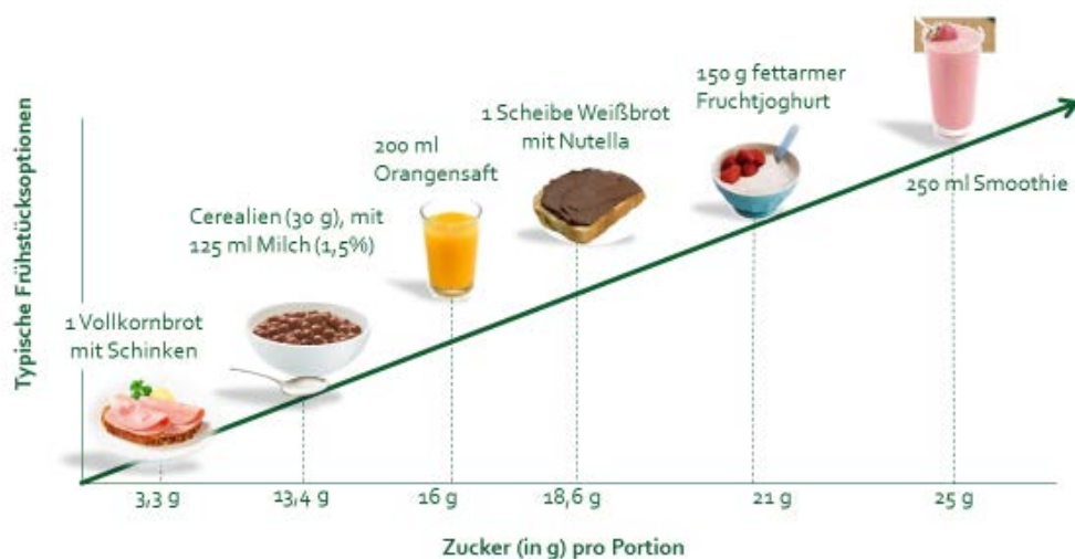
Abb.1: Zuckermenge unterschiedlicher Frühstückskomponenten

In den folgenden Abbildungen sind verschiedene Frühstücksoptionen mit ihrem jeweiligen Zucker- und Energiegehalt dargestellt. 25 Prozent der Tageskalorienmenge sollen laut DGE zum Frühstück verzehrt werden. Für eine Frau mit einem durchschnittlichen Energiebedarf von 2.000 kcal entspricht das 500 kcal. Bei der Betrachtung des Gesamtkaloriengehalts in Abbildung 2 bewegen sich Frühstücke mit Getreidekomponenten im unteren Normbereich.