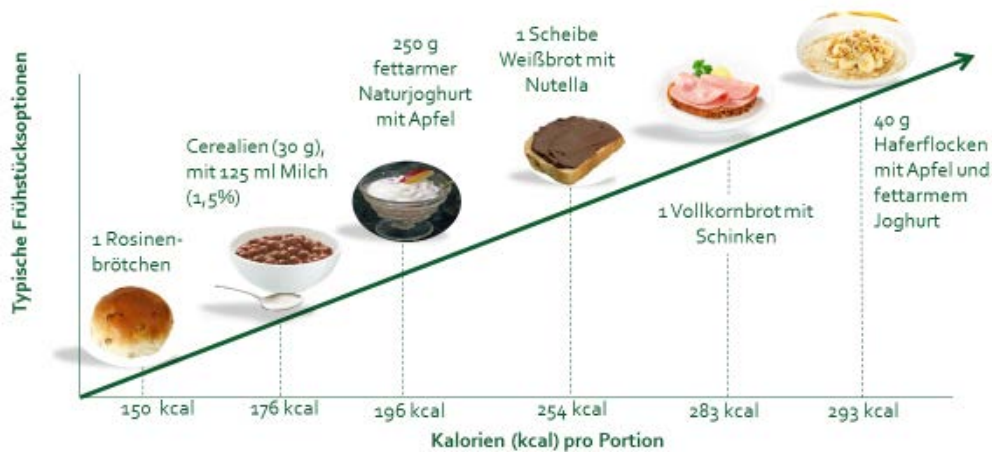
Abb.2: Energiegehalt unterschiedlicher Frühstückskomponenten